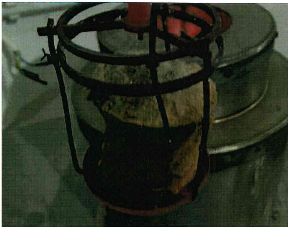
Рис. 1. Образцы после испытания

Аттестат аккредитации регистрационный номер ТРПБ.RU.ИН90 выдан 13.04.2015 г. Федеральной службой по аккредитации